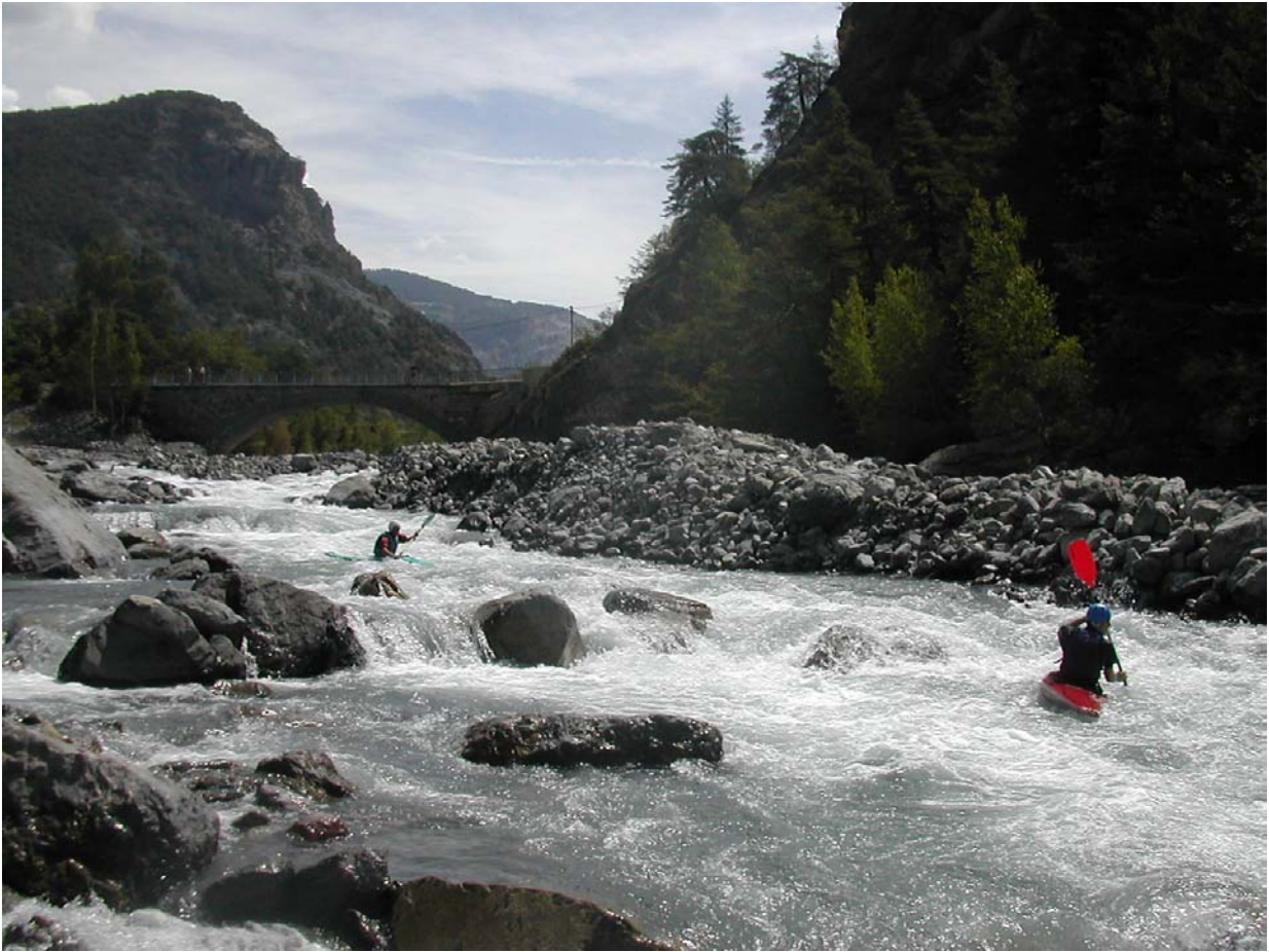
En aval du pont de la Fresquière