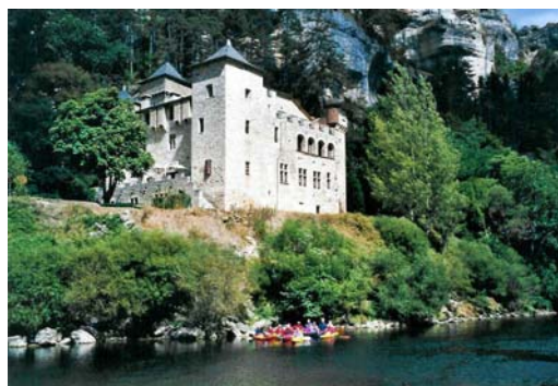
Bassin Eau Vive de Millau