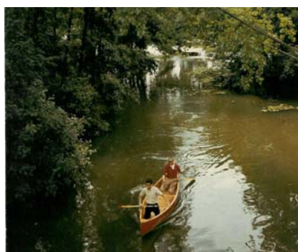
Moulin de Glandelle