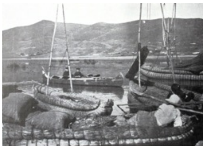
Illustrations extraites de la Rivière 228